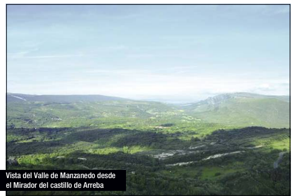
Vista del Valle de Manzanedo desde el Mirador del castillo de Arreba