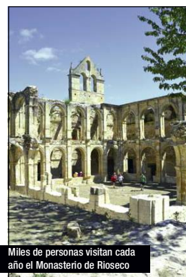
Miles de personas visitan cada año el Monasterio de Rioseco

guel de Cornezuelo con poca capacidad para tantas visitas por lo que es necesaria la construcción de un albergue o una instalación similar que permita comer y alojarse a los turistas que llegan, sin embargo con los recursos propios de un Ayuntamiento tan pequeño estas obras no se pueden realizar por lo que necesitan la implicación de las administraciones.